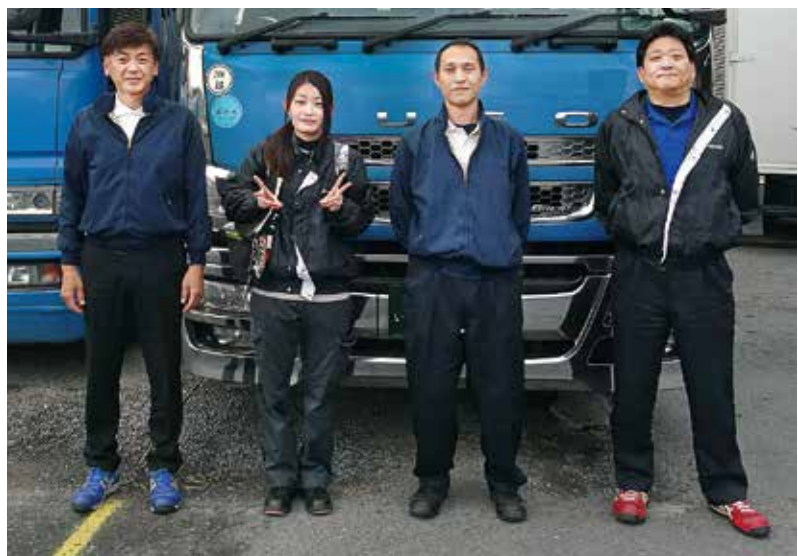
社員のみなさまと一緒にハイポーズ!

A:今は女性でも対応可能な業務も増 えたので、機会があれば採用を考 えています。