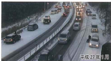
名阪国道 南在家IC付近