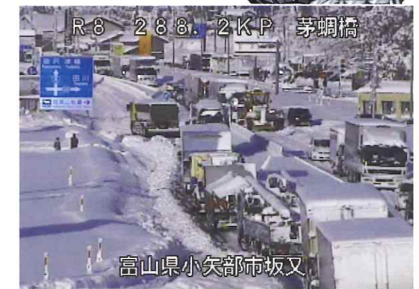
平成30年1月12日 朝の状況 国道8号 小矢部市