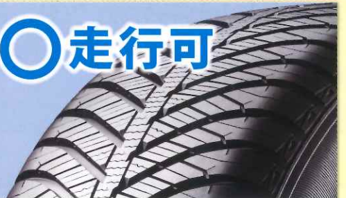
スノーフレックマーク付 オールシーズンタイヤ (タイヤ側面表記: スノーフレックマーク)