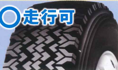
スノータイヤ (タイヤ側面表記: SNOWもしくはスノーフレックマーク)