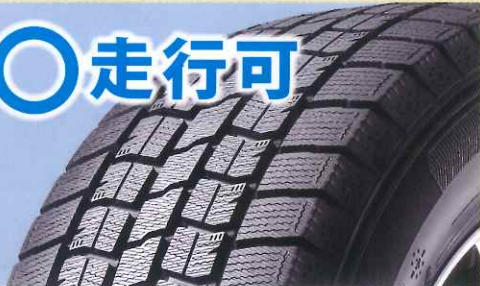
スタッドレスタイヤ (タイヤ側面表記: STUDLESS)