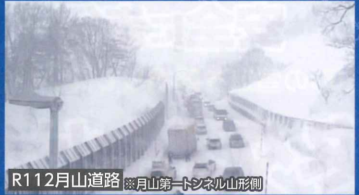
R112月山道路 ※月山第一トンネル山形側