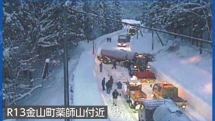
R13金山町薬師山付近