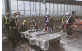
伸縮装置取替状況