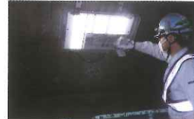
トンネル照明の点検