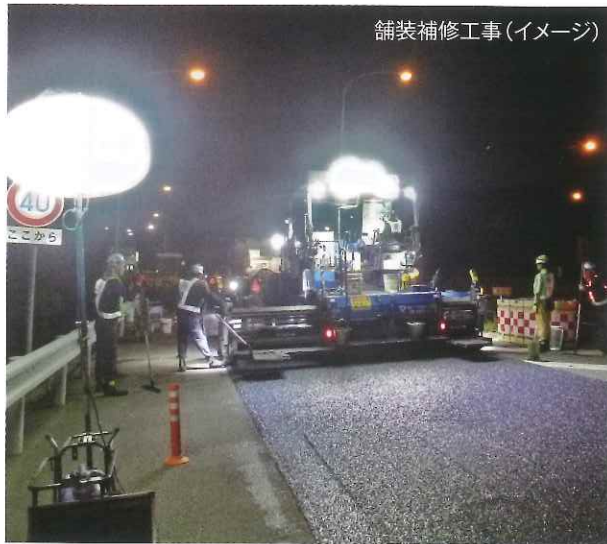
舗装補修工事(イメージ)

工事の実施にあたり、通常の車線規制では車両が通行するために必要な幅員が確保できないことから夜間IC閉鎖を行います。