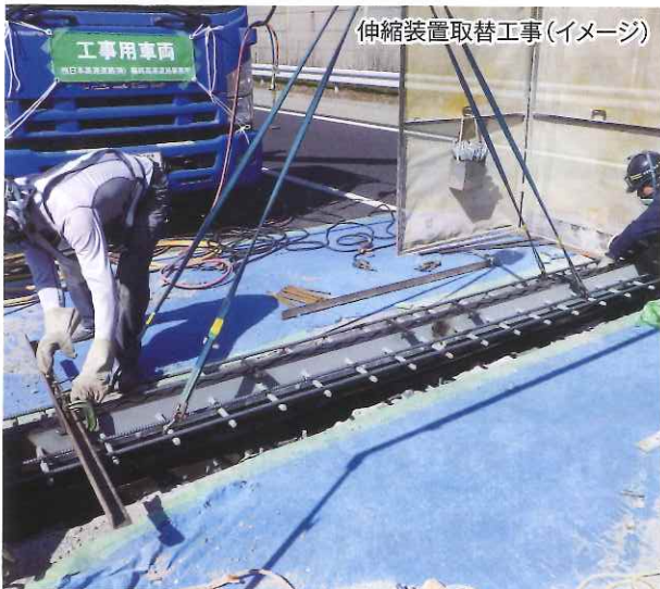
伸縮装置取替工事(イメージ)