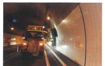
トンネルの側壁清掃