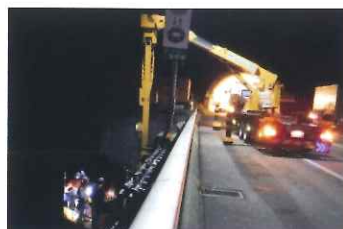
橋梁点検車を用いた橋梁下面および橋桁の点検