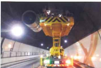
トンネルジェットファン点検