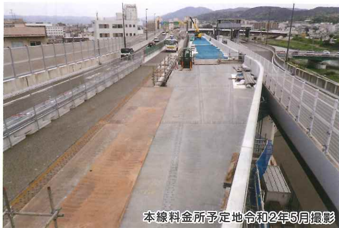
本線料金所予定地令和2年5月撮影

本線料金所の新設に伴い、 終日通行止め を行っております。 高速道路や一般国道等をご利用のお客さまや沿道の皆さまにはご不便・ご迷惑をお掛けいたしますが、工事へのご理解・ご協力をお願い致します。