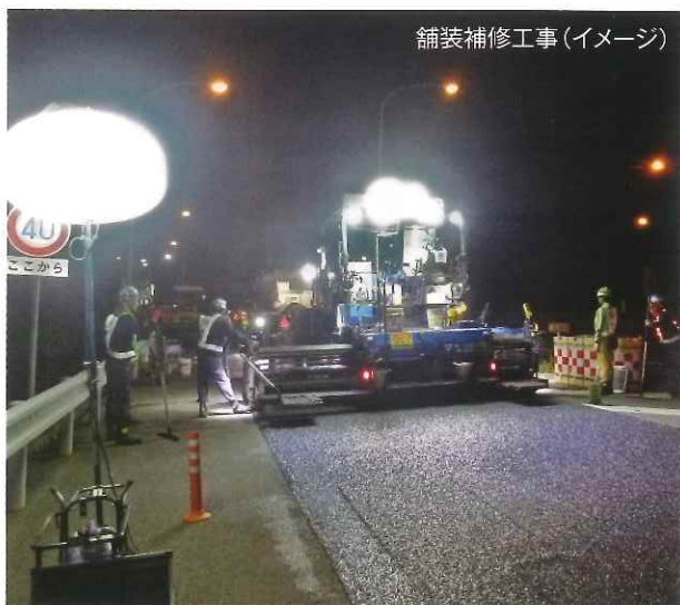
舗装補修工事(イメージ)

お客さまが高速道路を安全で快適にご利用いただけるよう、E2A中国自動車道 ひょうご東条ICの舗装補修工事及び伸縮装置取替工事を行います。工事の実施にあたり、車両が通行するために必要な幅員が確保できないことから夜間IC閉鎖を行います。