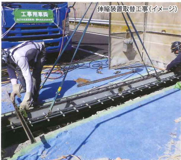
伸縮装置取替工事(イメージ)