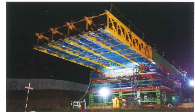
橋桁の送出し施工例

北陸道(今庄~福井間)の上空に、北陸新幹線の橋りょう(福井、 武生、第3庄架道橋)を架設する工事をおこないます。