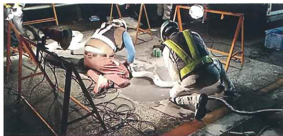
道路構造物の点検・補修