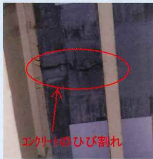
舗装下のコンクリートの劣化状況