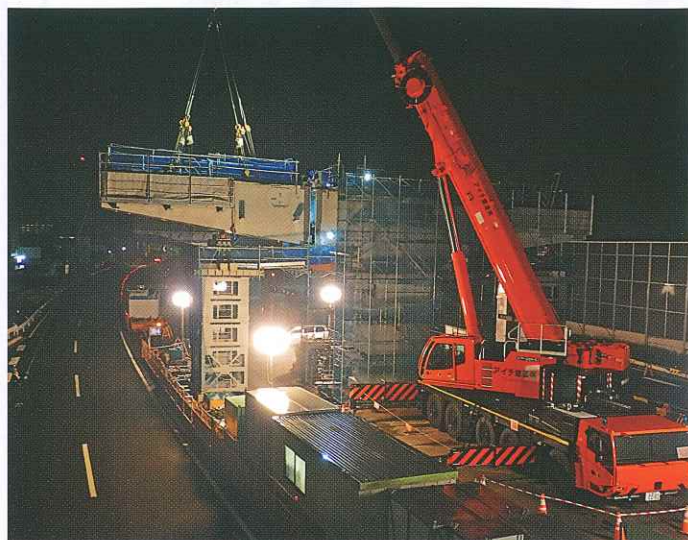
〈鋼製橋脚架設工事（イメージ）〉

高速道路をご利用のお客さまや沿道の皆さまには、ご不便、ご迷惑をおかけしますが、工事へのご理解・ご協力をお願いいたします。また、ご出発前には最新の交通情報をご確認のうえ、計画的にお出かけいただきますようお願いいたします。