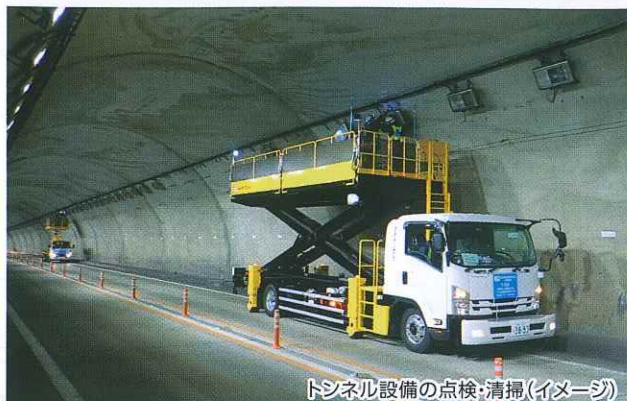
トンネル設備の点検・清掃(イメージ)

お客さまに高速道路を安全で快適にご利用いただけるよう、 E27 舞鶴若狭自動車道、 E9 京都縦貫自動車道および E9 山陰近畿自動車道で通行止めを実施し、トンネル 設備の点検・清掃・舗装補修工事などをおこないます。