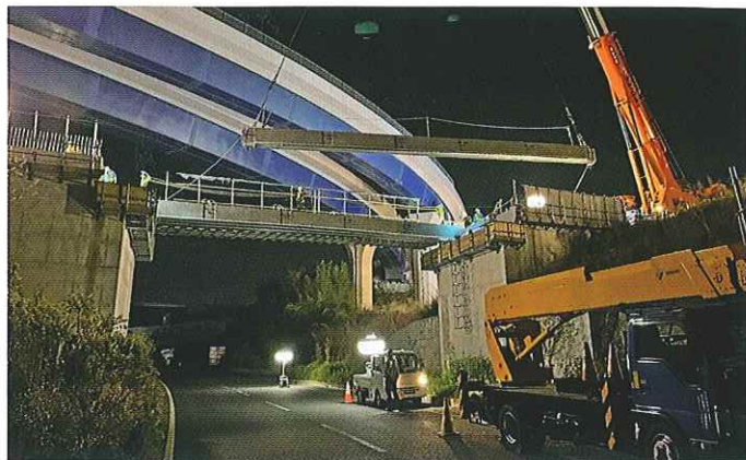
橋梁架設工事の様子(イメージ)

工事期間中はご不便とご迷惑をおかけいたしますが、ご理解とご協力をお願いいたします。