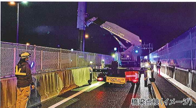
橋梁点検(イメージ)