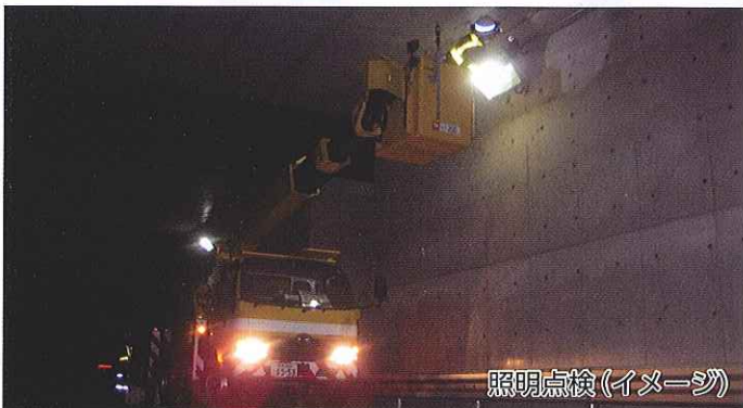
照明点検(イメージ)