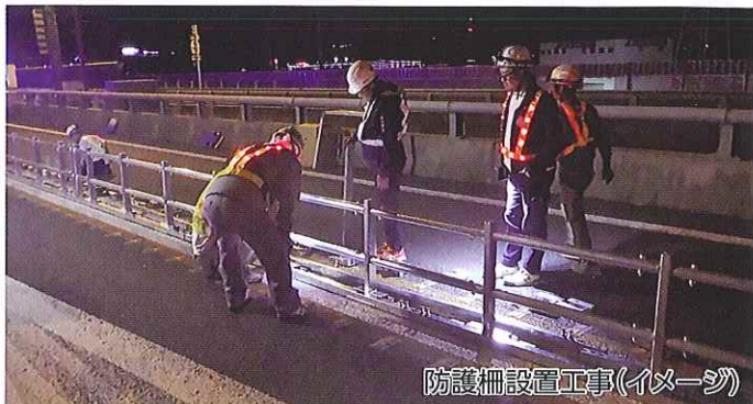
防護柵設置工事(イメージ)