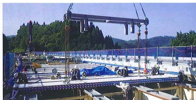
プレストレストコンクリート床版架設

損傷した鉄筋コンクリート床版を、より耐久性の高い床版に取り替えます。 (プレストレストコンクリート床版)