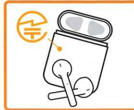
ワイヤレスイヤホン:本体や外箱など