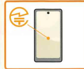
スマートフォン等では、液晶画面に表示される場合もあります