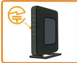
無線LAN 据え置き型の機器:裏面