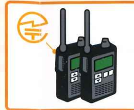
トランシーバー:裏面または内蔵バッテリーを取り外した部分