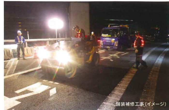
舗装補修工事(イメージ)

工事実施期間中はご不便とご迷惑をおかけいたしますが、何卒ご理解とご協力をお願いいたします。