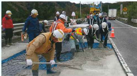
橋梁の舗装下のコンクリートを補修します。