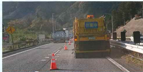
路面清掃を実施します。