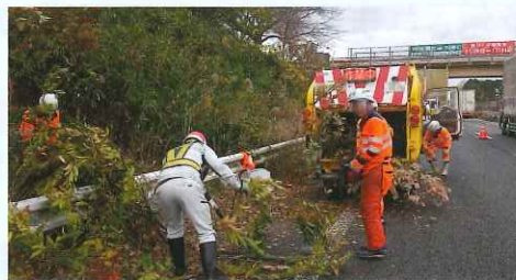
除草作業を実施します。