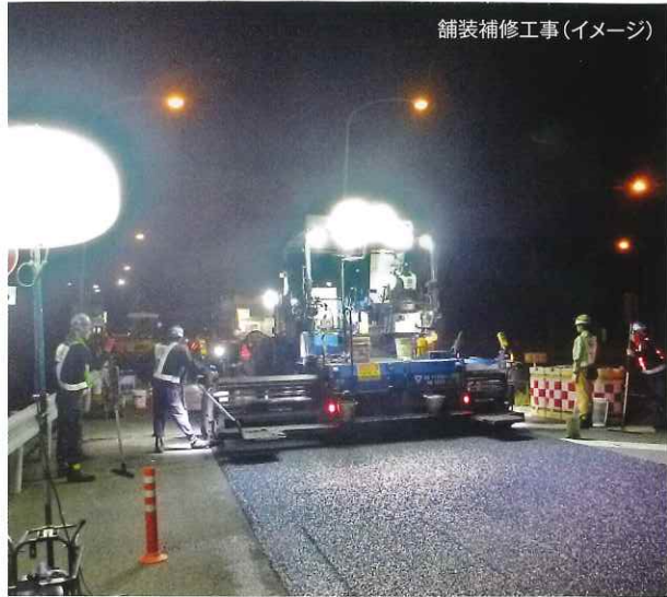
舗装補修工事(イメージ)

E2 山陽自動車道白鳥PA(下り線)の舗装補修工事を実施します。工事の実施にあたり、車両の通行する幅員が確保できないことから夜間閉鎖を行います。