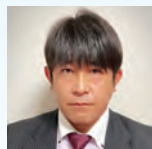
株式会社クボタ 物流統括部担当部長