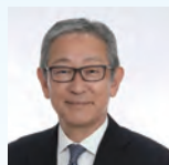
阪神国際港湾株式会社 代表取締役社長