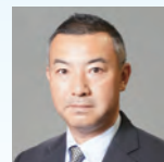
国土交通省港湾局 港湾経済課長