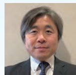
株式会社ノーリツ 生産管理部物流グループリーダー