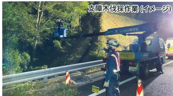
支障木伐採作業(イメージ)

お客さまに高速道路を安全で快適にご利用いただけるよう、 E29 播磨自動車道 「播磨JCT～宍粟JCT間」において、伐採・清掃等の維持修繕工事及び構造物点検を行います。