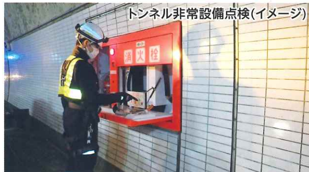
トンネル非常設備点検(イメージ)