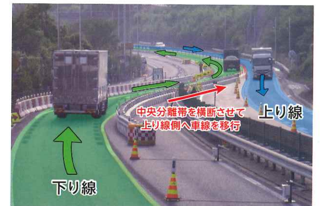
中央分離帯を横断させた車線の移行状況(別工事での例)