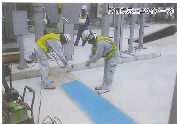
路面標示工事(イメージ)

工事の実施にあたり、車両が通行するために必要な幅員が確保できないことから夜間閉鎖を行います。