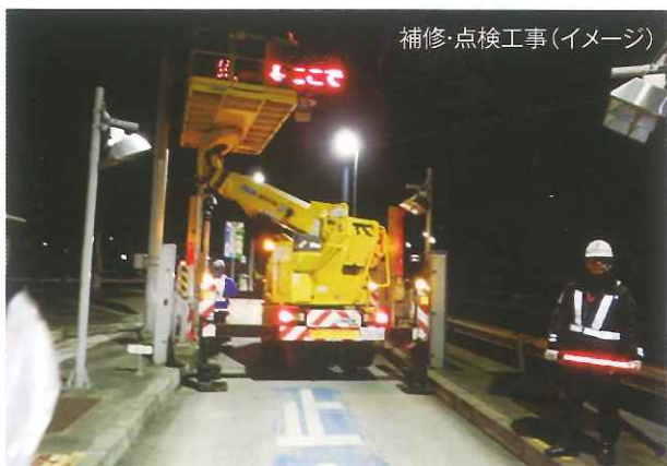
補修・点検工事(イメージ)