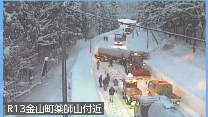
R13金山町薬師山付近