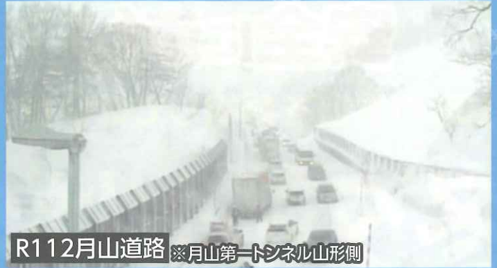
R112月山道路 ※月山第一トンネル山形側