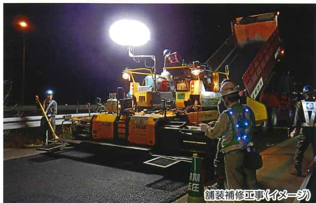
舗装補修工事(イメージ)

※通行止めの時間帯は、区間内のSA・PAがご利用できません のでご注意ください。