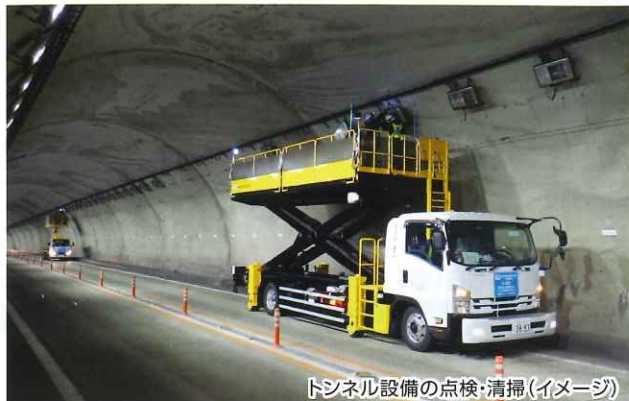
トンネル設備の点検・清掃(イメージ)

お客さまに道路を安全で快適にご利用いただけるよう、 E27 舞鶴若狭自動車道 、 E9 京都縦貫自動車道 および E9 山陰近畿自動車道 で夜間通行止めを実施し、 トンネル設備の点検・清掃・舗装補修工事などを行います。