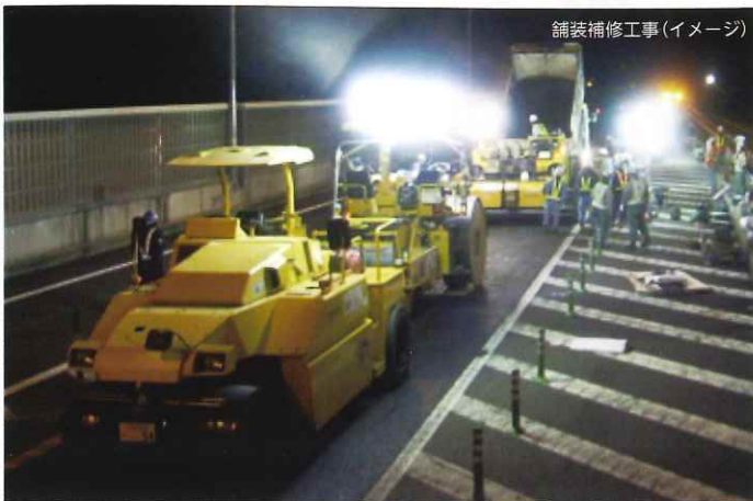
舗装補修工事(イメージ)

工事実施期間中はご不便とご迷惑をおかけいたしますが、何卒ご理解とご協力をお願いいたします。