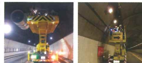
トンネルジェットファン点検 トンネル照明設備点検