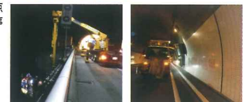
橋梁点検車を用いた橋梁下面および橋桁の点検 トンネルの側壁清掃