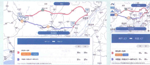
※画面は変更となる可能性があります。