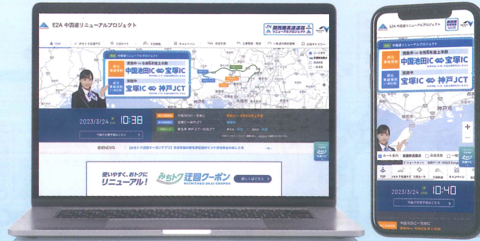
※画面はイメージです。