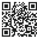
広島県警察 公式 Twitter