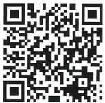
広島県警察 サミット対策課HP

高速道路の交通規制予定期間及び予定路線等や交通規制に関するQ&Aなどが確認できる広島県警察のサイトです