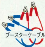
ブースターケーブル