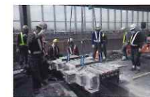
1. 既存の橋梁伸縮装置を撤去