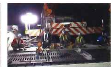
3. 新しい橋梁伸縮装置の設置