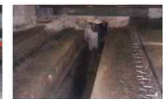
2. 橋梁伸縮装置の撤去後の状況