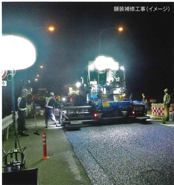
舗装補修工事(イメージ)

E26 阪和自動車道堺ICの舗装補修・標識工事を実施します。工事の実施にあたり、車両の通行する幅員が確保できないことから夜間閉鎖を行います。