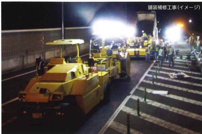
舗装補修工事(イメージ)

工事実施期間中はご不便とご迷惑をおかけいたしますが、何卒ご理解とご協力をお願いいたします。