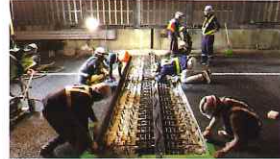
橋梁伸縮装置取替状況