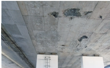
松島高架橋 床版下面 コンクリートの剥離

阪和自動車道 和歌山北IC～和歌山南SIC間は、1974年(昭和49年)の開通から約50年が経過しています。当該区間の橋梁は、コンクリートの材料として用いる骨材にやむなく海砂を使用したことで、塩害による著しい損傷が発生しています。また、モータリゼーションの発展に伴い大型車の交通量が増加するとともに、規制緩和により車両の総重量が増加する傾向にあり、過酷な環境に置かれています。これまでも定期的に点検を行いながら部分的な補修・補強を繰り返してきましたが、構造物の長期的な安全性や耐久性の確保が困難になりつつあります。そこで、既設橋を撤去し、新たに橋を架け替える抜本的なリニューアル工事を行うことにより、これまでより耐久性のある安全・安心な道路へと生まれ変わります。