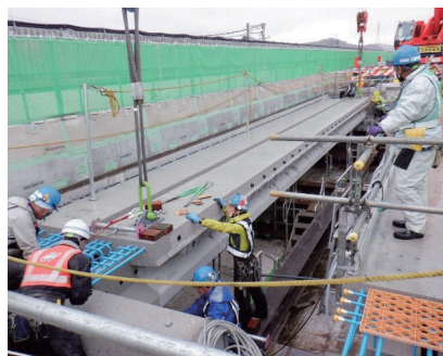
コンクリート桁の架設状況