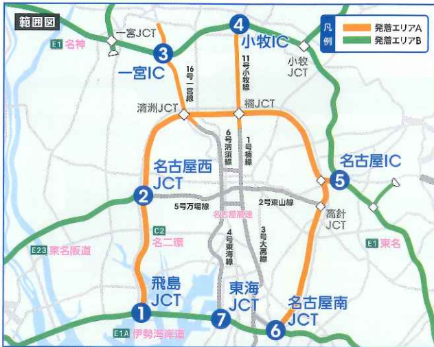
接続部の組み合わせ

発着エリアBのIC相互間を、下表に記載の路線接続部間の組み合わせを経由して、主な渋滞予測区間を名古屋高速やE1A伊勢湾岸道、C2名二環へ迂回して走行していただいた場合には、主な渋滞予測区間を直通利用された場合の料金と同額になるように通行料金を調整します。