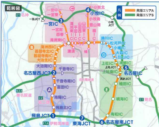
接続部とICの組み合わせ

左表の発着エリアA・B間を、主な渋滞予測区間を避けて名古屋高速やE1A伊勢湾岸道、C2名二環へ迂回して、路線接続部と発着エリアAの組み合わせで走行していただいた場合には、主な渋滞予測区間を直通利用された場合の料金と同額になるように通行料金を調整します。