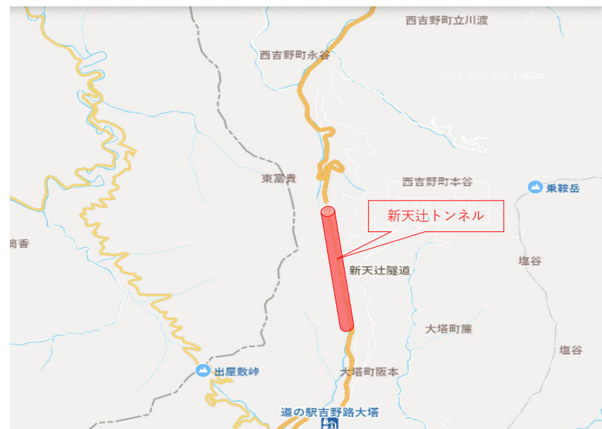
西吉野町永谷側坑口（北側）