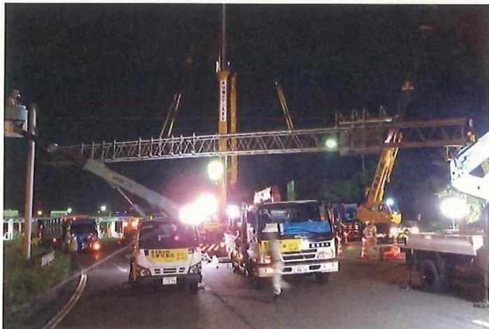
標識柱の撤去イメージ

高速道路管理車両（黄色のパトロールカー等）がお客さまの前方で速度を調整し、前方のお客さまとの間に車両がない状態を数分間つくり、その間に工事（標識柱の撤去）を実施する規制です。