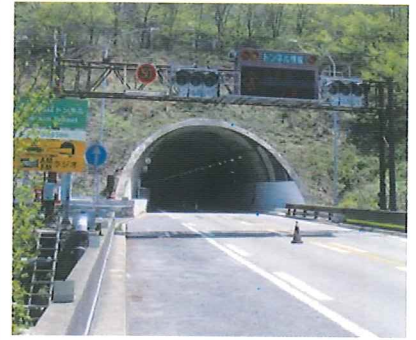
参考: トンネル入口信号