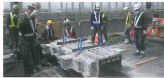
橋梁の伸縮装置取替状況

E1A 伊勢湾岸道は、非常に交通量が多いため、金属疲労による伸縮装置の亀裂や破断などの損傷が目立っています。平坦性の確保と道路の安全性を強化するために、早急に取り替える必要があります。