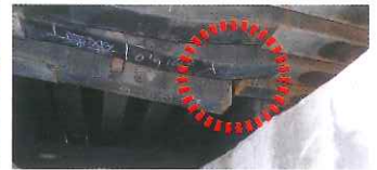
下面から見た伸縮装置の破断状況