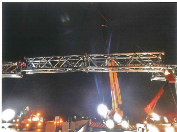
門型柱設置工事(イメージ)

本通行止め工事において、 E29 中国横断自動車道(姫路鳥取線)と E2A 中国自動車道の接続に伴う、新たに設置する中央ジャンクションの案内標識の門型支柱並びに標識板の設置を行います。また、佐用ジャンクションの番号板を順次変更します。その他、お客さまに高速道路を安全で快適にご利用いただけるよう、舗装補修、構造物点検などをあわせて行います。