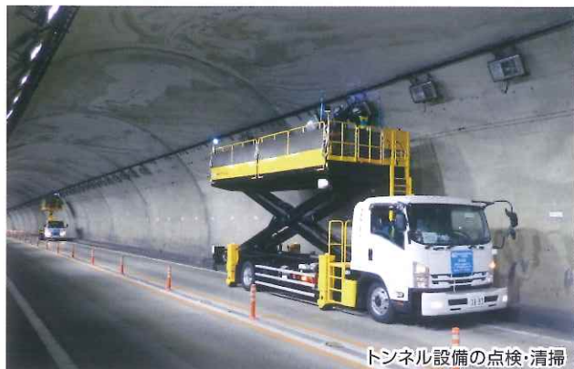
トンネル設備の点検・清掃

お客さまに道路を安全で快適にご利用いただけるよう、 E27 舞鶴若狭自動車道 、 E9 京都縦貫自動車道 および E9 山陰近畿自動車道 で夜間通行止めを実施し、 トンネル設備の点検・清掃・舗装補修工事などを行います。