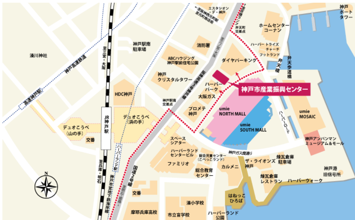
神戸駅前地下街(デュオこうべ)拡大図