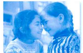
大阪ユニセフ協会