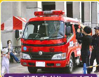
ミニ消防車がやってくる!