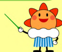
気象庁マスコットキャラクター「はれるん」

ご記入いただいた個人情報は適切に管理し、ご本人確認のための情報として利用させていただきます。 ご本人の同意なしにそのほかの目的での利用・提供はいたしません。