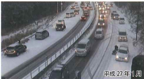
名阪国道 南在家IC付近